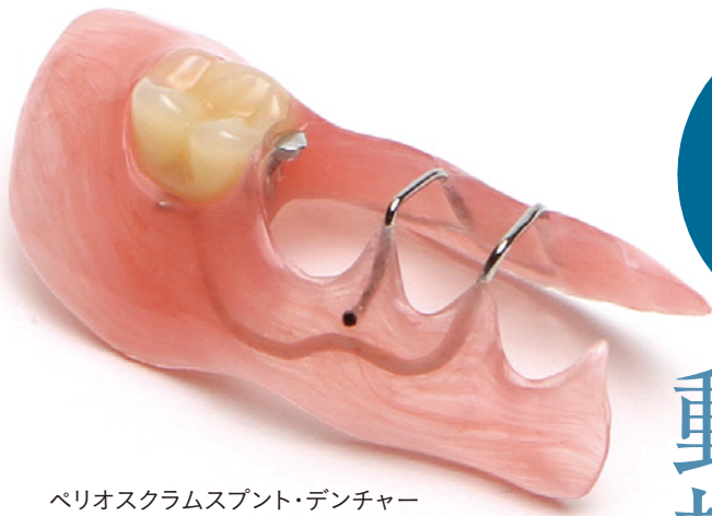
ペリオスクラムスプント・デンチャー (ペリオスプリント)

歯周病の第一人者である横田先生をお迎えして、横田先生の考える歯周咬合とリハビリテーションとは?これまでの歯周治療と何が違うのか?新しいリハビリテーション型欠損補綴とは何か?について講義していただきます。