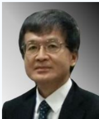
神奈川歯科大学 歯周病学教授 医科歯科連携センター 三辺正人先生

歯科医師 17,000円 歯科衛生士 8,000円 歯科技工士 8,000円 スタッフ 7,000円