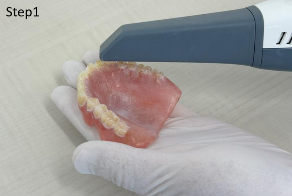
IOSで義歯をスキャン