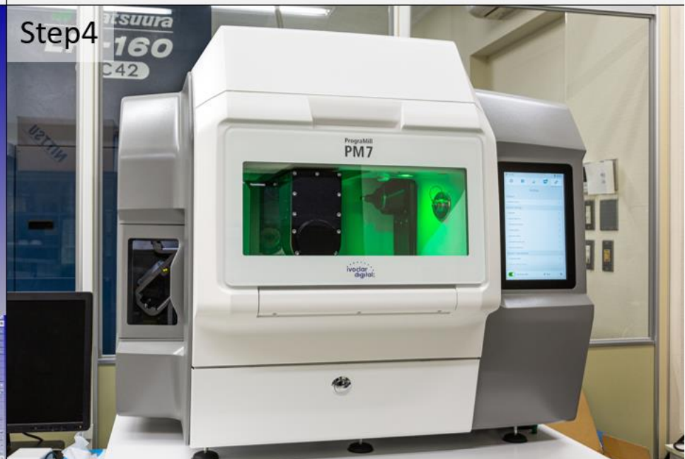
PM 7 (Ivoclar社製) にてミリング